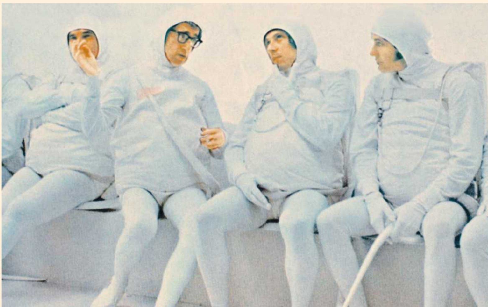
Wessen Spermium zum Zug gekommen ist, kann für Streit bis vor die höchsten Gerichte sorgen. Szene aus Woody Allens Film „Was Sie schon immer über Sex wissen wollten“

enable ist die monatliche Managementbeilage der FT. Sie erscheint wieder am 6. Dezember.