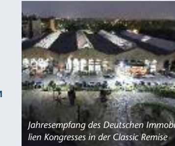
Jahresempfang des Deutschen Immobilien Kongresses in der Classic Remise

19.30 Uhr Jahresempfang in der Classic Remise Berlin